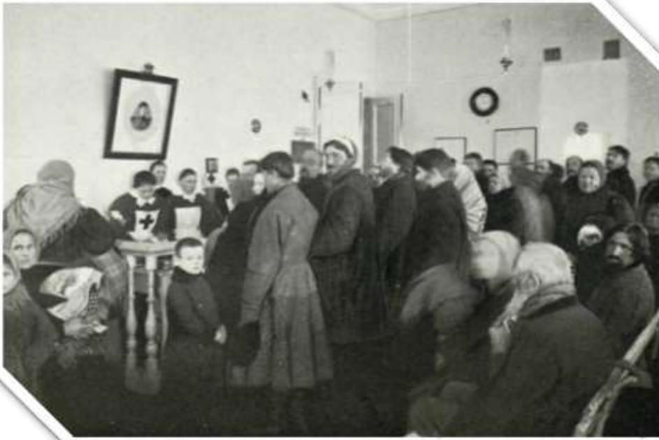
Елизаветинская в 1896 году в Санкт-Петербурге.

Иверская была открыта в 1894 году на Малой Якиманке.