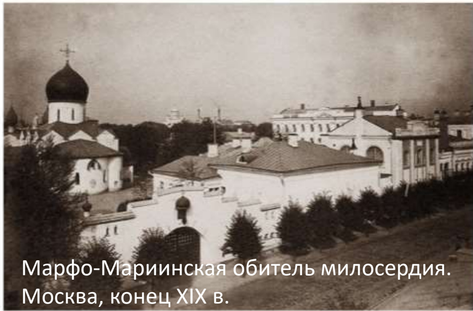
Марфо-Мариинская обитель милосердия. Москва, конец XIX в.

В обители были созданы больница, амбулатория, аптека, где часть лекарств выдавали бесплатно, приют, бесплатная столовая и ещё множество учреждений. В Покровском храме обители проходили просветительские лекции и беседы, заседания Палестинского общества, Географического общества, духовные чтения и другие мероприятия.